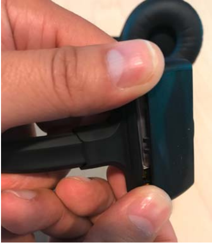
SDW 30 HS