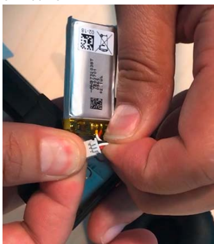
SDW 30 HS