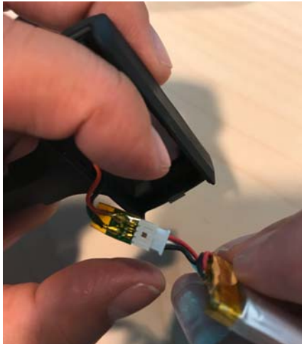
SDW 30 HS