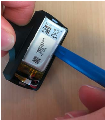
SDW 30 HS