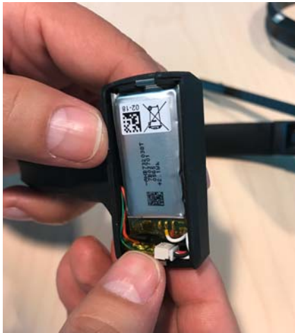
SDW 30 HS